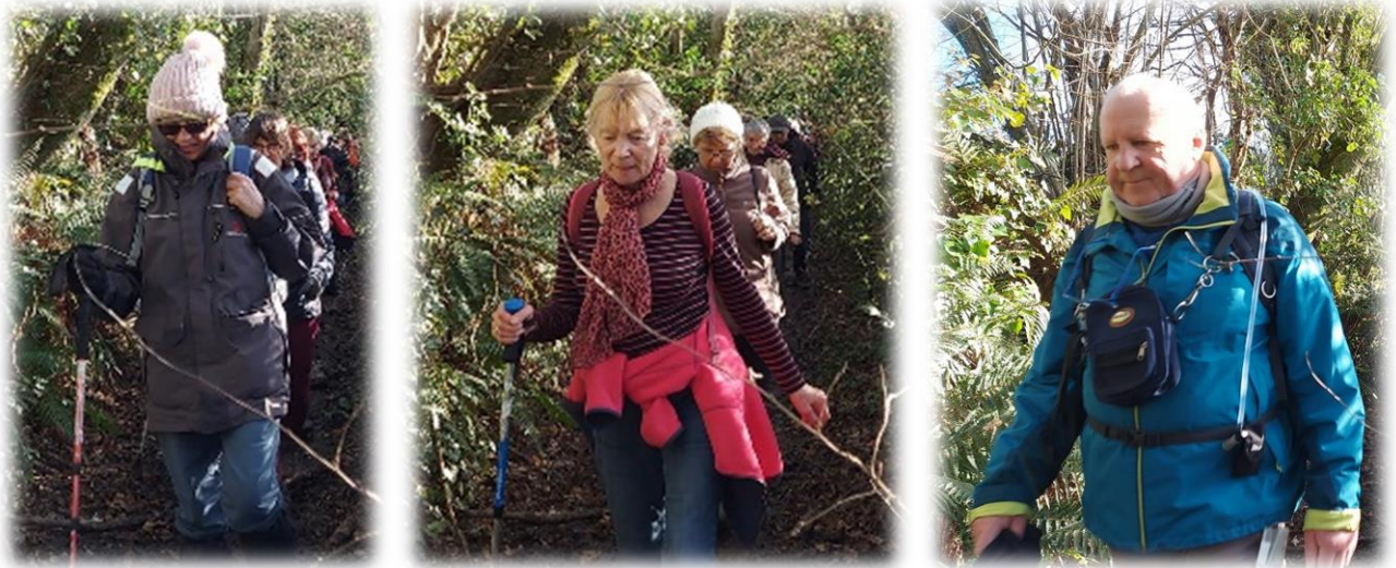
Différents styles vestimentaires, en cette journée ensoleillée, avec vent glacial.