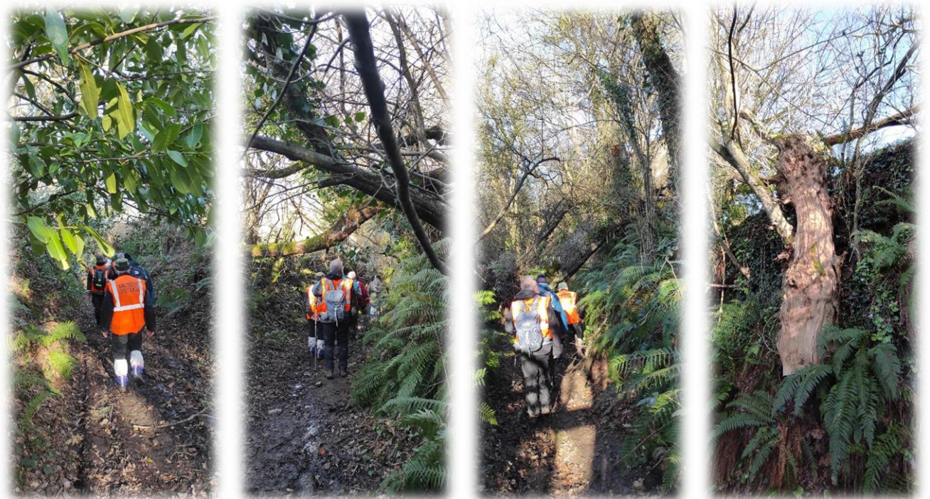
Puis une chasse encaissée avec quelques embûches