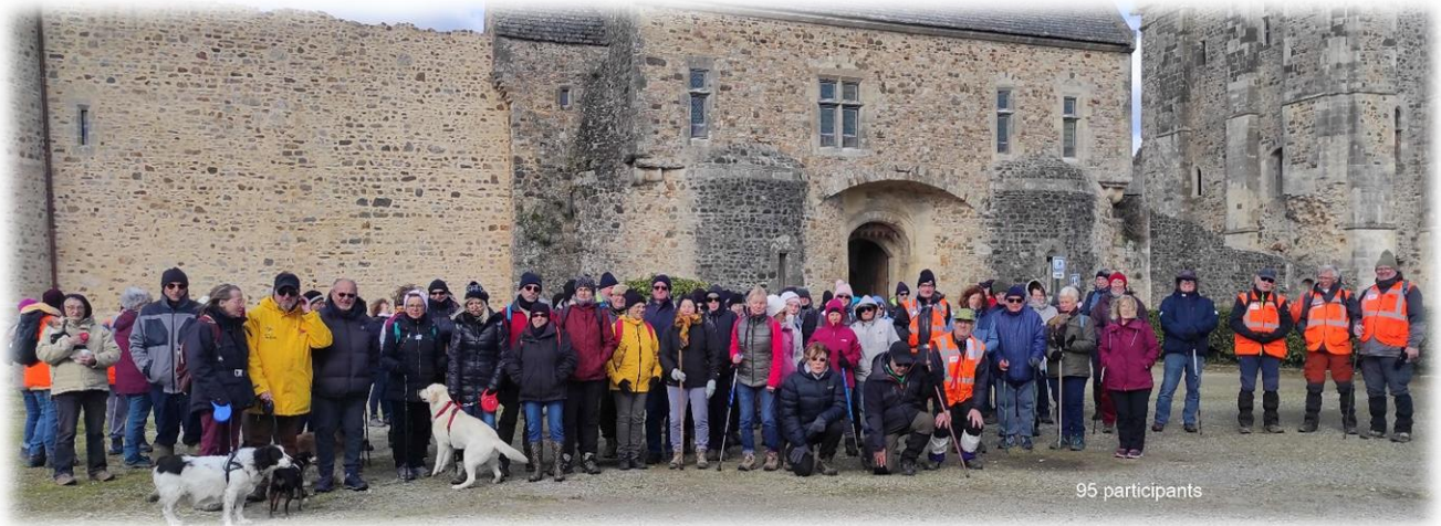
Bel endroit pour une photo de famille