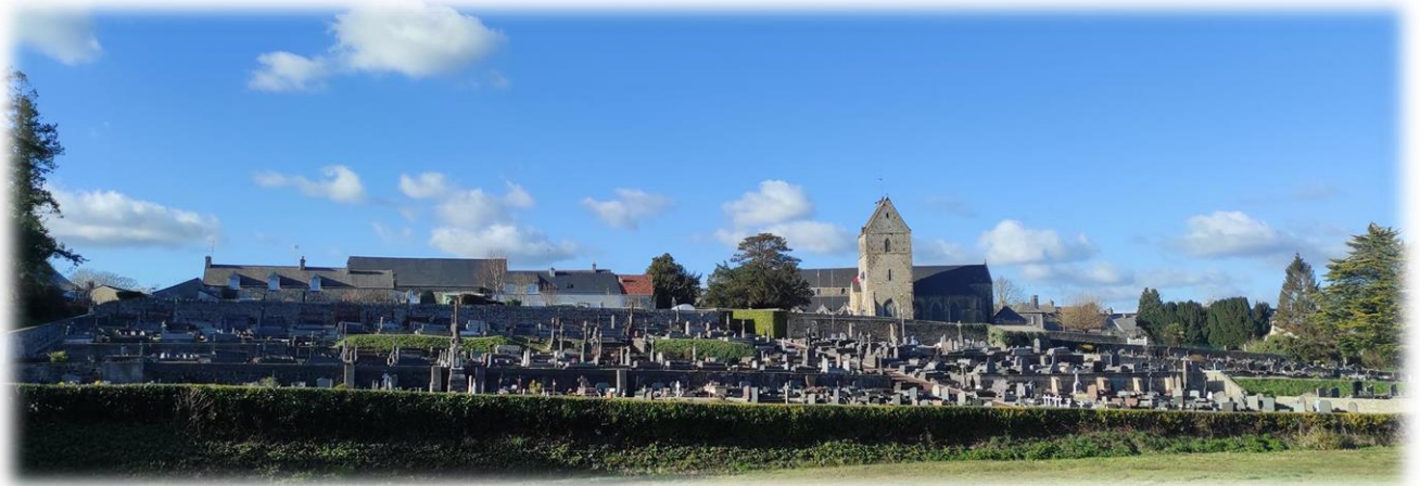
Eglise Saint-Jean-Baptiste (XII e -XV e -XIX e ) et son cimetière Initialement, l'église se situait à l'intérieur du château. Elle aurait été transférée ici au début du XII e siècle.

Retour au parking en empruntant des petites ruelles médiévales.