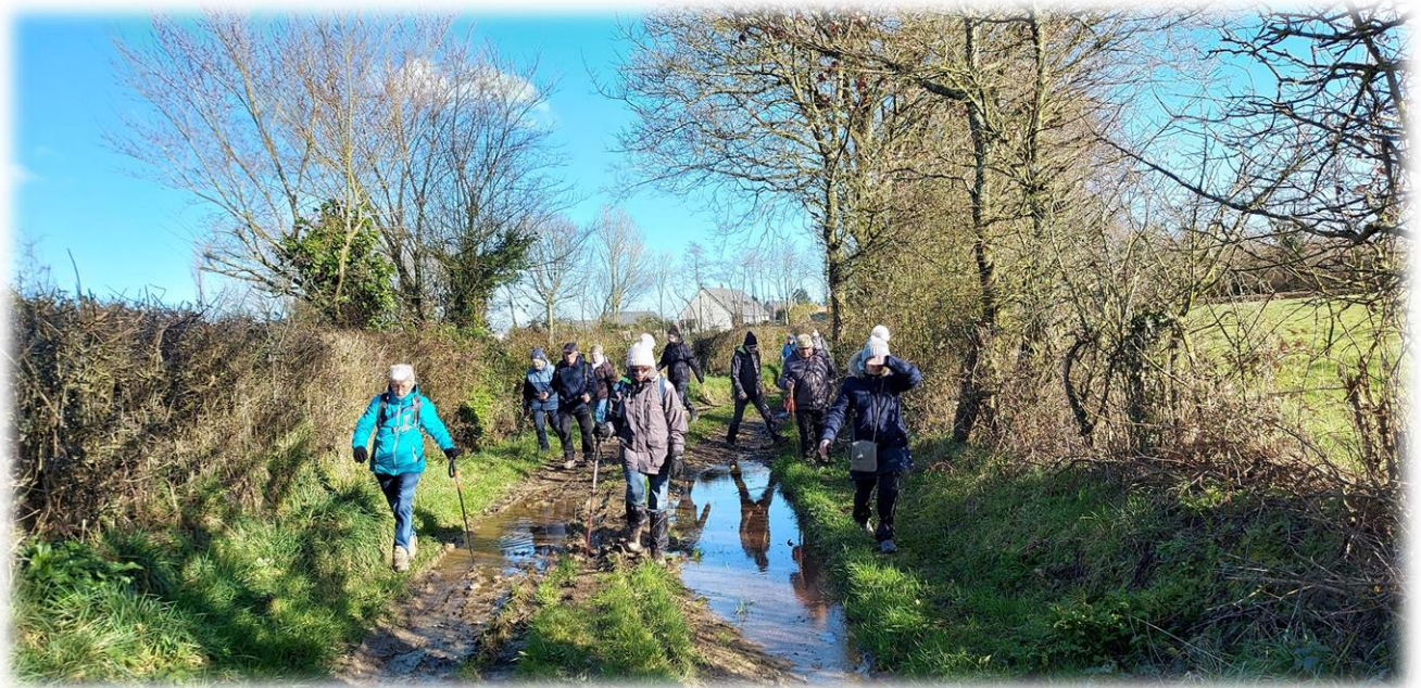
Attention zone humide